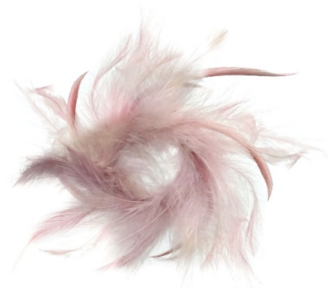
Dezente Osterdekoration von Shishi in mildem Rosé.

Bei hearted + minimal bestimmen feinsinnige Farben die Palette. Dabei dominieren die neutrale Reihe ein helles Grau-Weiß, ein mittleres Grau und tiefes Schwarz. In der kühlen Reihe ein nordisches Blau, frostiges Mint und winterliches Grün. Die warme Farbreihe beginnt mit Gold, gefolgt von sanftem Ahorn und mildem Rosé.